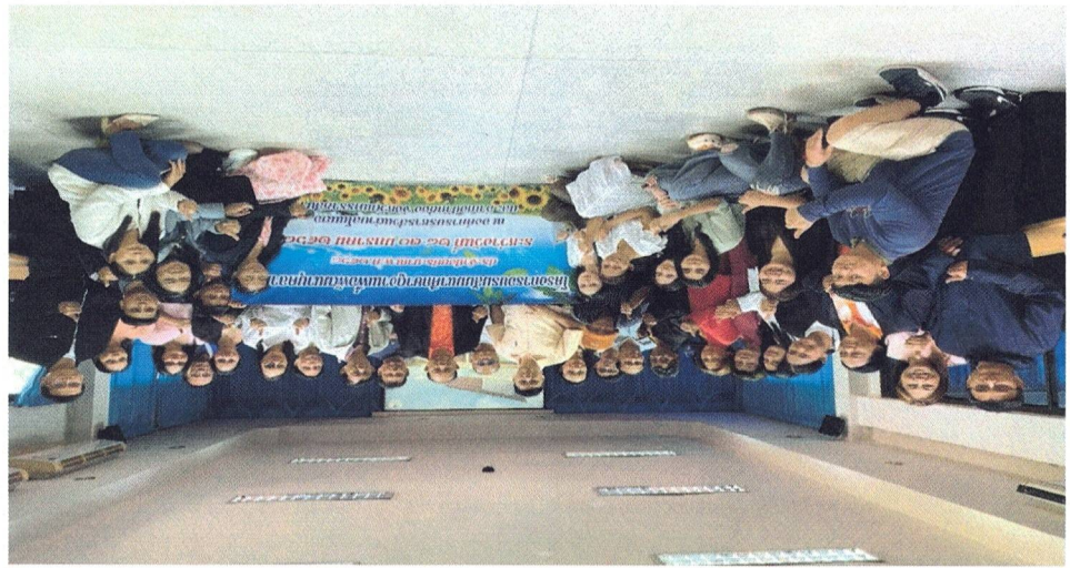
อบรมส่งเสริมงานเพื่อพัฒนาบุคลากร/เจ้าหน้าที่ศูนย์ส่งเสริมสุขภาพอนามัยของราชการ

๓. Happy Society การส่งเสริมให้เกิดความสามารถของคน