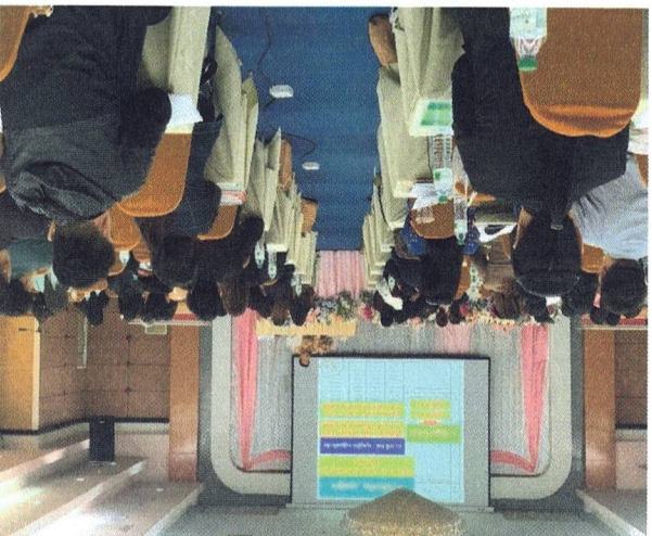
โดยภาพการส่งเจ้าหน้าที่ผู้ดูแลการอบรมตามตำบลต่างๆ และศูนย์ฯ

๕. Happy Brain การส่งเสริมสุขภาพจิตในผู้สูงอายุ