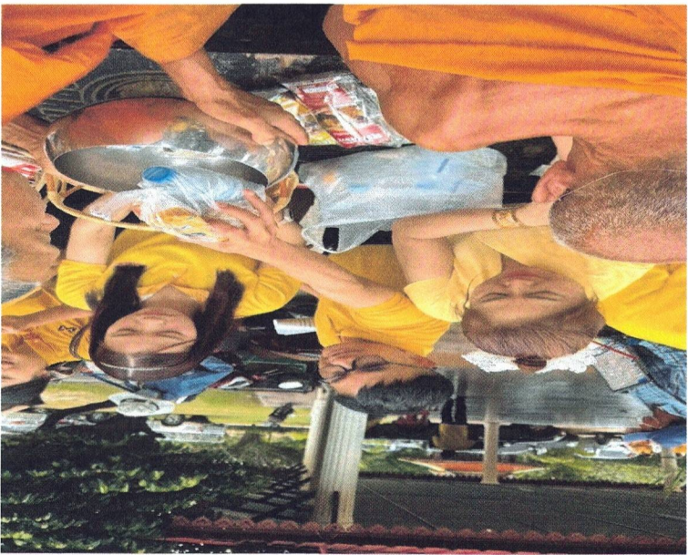
๖. Happy Soul การส่งเสริมให้บุคคลากรมีศีลธรรมในการดำเนินชีวิต